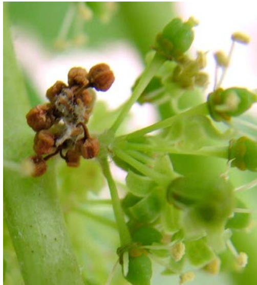
Εικόνα 1. Προσβολή ανθοταξίας από προνύμφες 1 ης γενιάς

Ο Προϊστάμενος του Π.Κ.Π.Φ.Π. & Φ.Ε. Θεσσαλονίκης